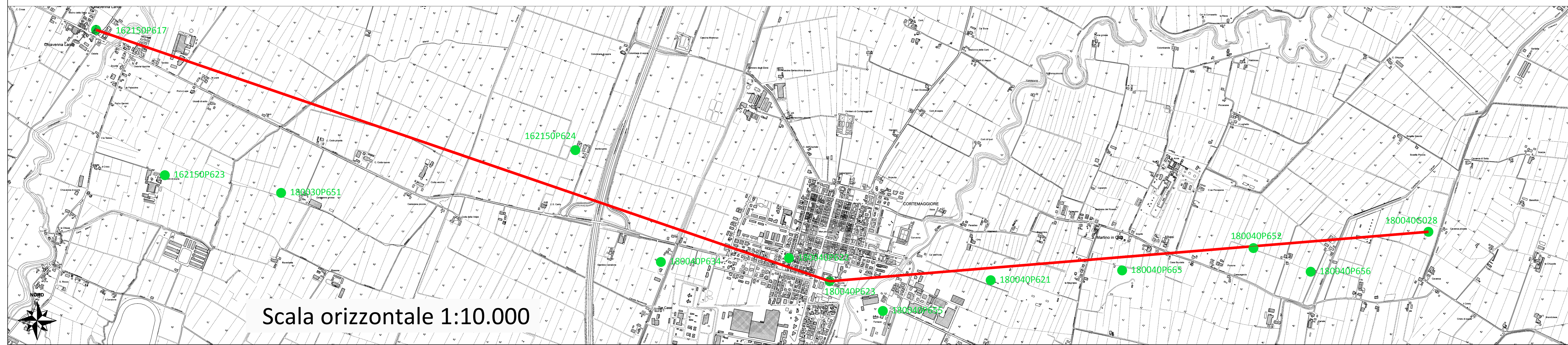
Scala orizzontale 1:10.000