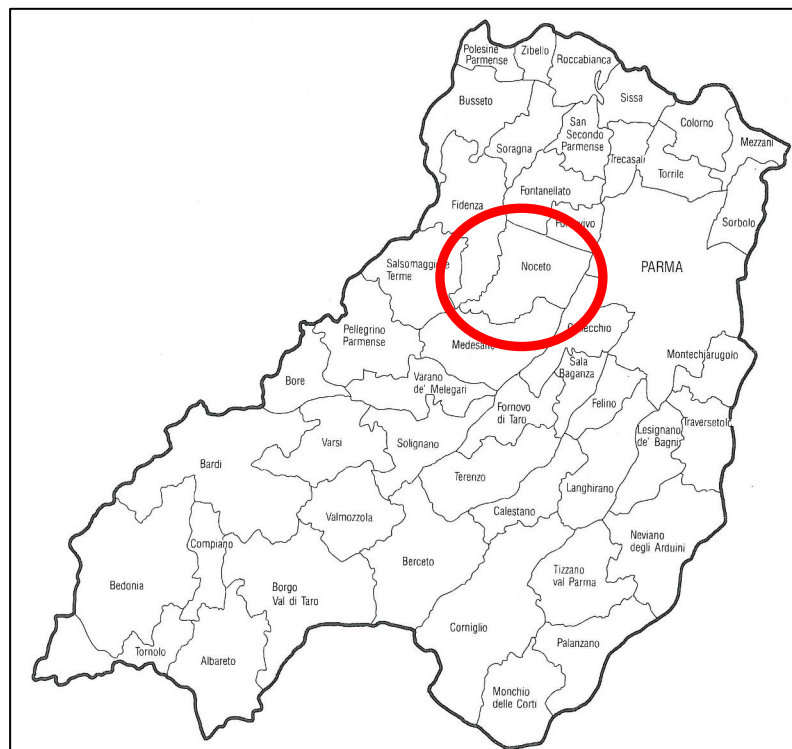
Figura 2.1 – Ubicazione del Comune di Noceto nel territorio della Provincia di Parma.