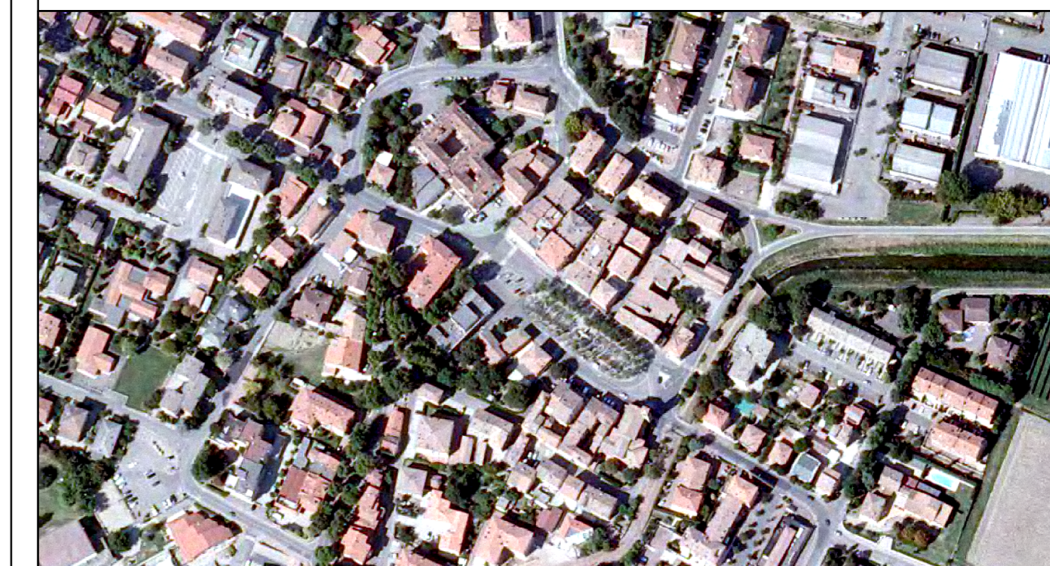
APPROFONDIMENTI DI PRIMO LIVELLO QC.02.1.1.2.1 SEZIONI GEOLOGICHE - 1 Scala 1:10.000

Adottato con DCC n xxx del xx/xx/201x Approvato con DCC n xxx del xx/xx/201x