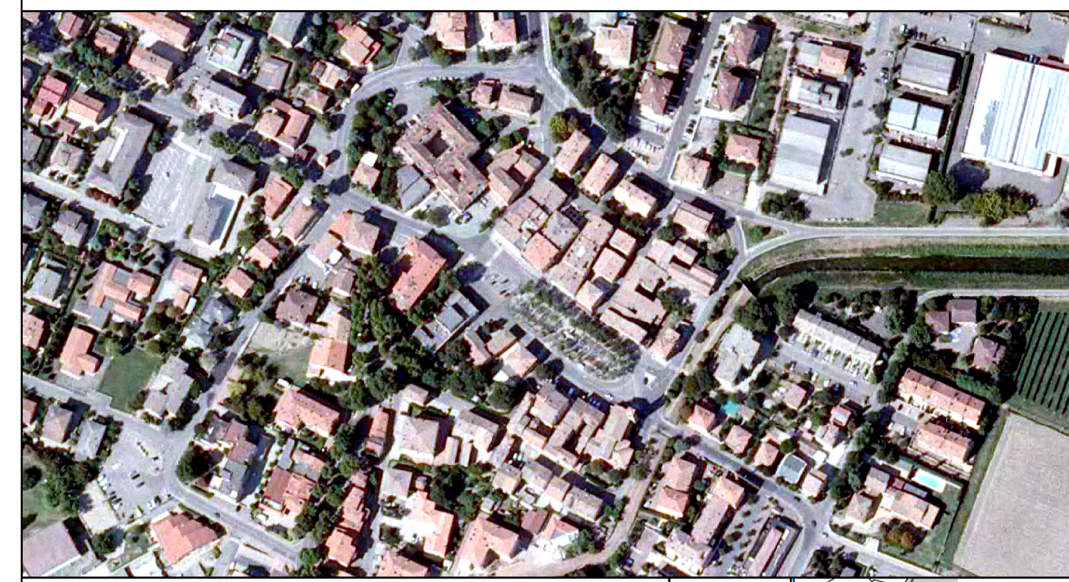
APPROFONDIMENTI DI PRIMO LIVELLO QC.02.1.1.4 SOGGIACENZA PRIMO ACQUIFERO Scala 1:10.000

Adottato con DCC n xxx del xx/xx/201x Approvato con DCC n xxx del xx/xx/201x