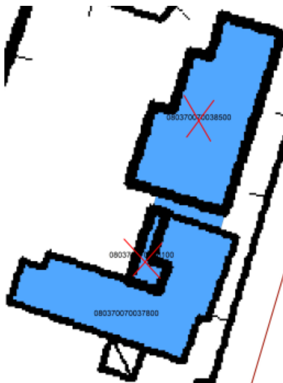
Stralcio cartografico dell'aggregato strutturale 080370070037800.