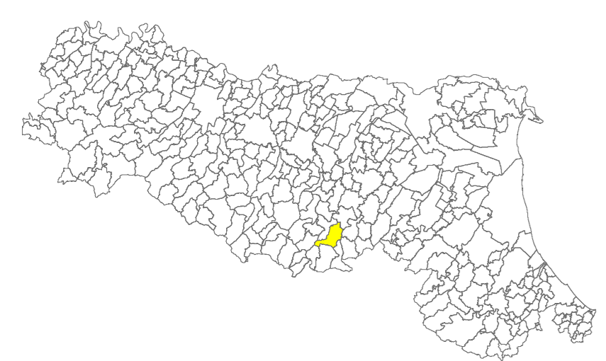
Tavola 7a - FA 0.1-0.5s

Regione Emilia-Romagna Comune di Grizzana Morandi