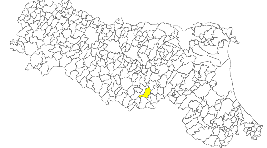
Tavola 9a - FA 0,7-1,1s

Regione Emilia-Romagna Comune di Grizzana Morandi