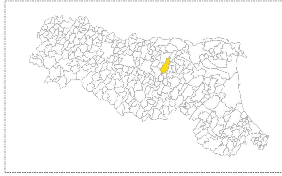
TAVOLA 1 di 4

Regione REGIONE EMILIA ROMAGNA Soggetto realizzatore COMUNE DI SAN GIOVANNI IN PERSICETO Data Agosto 2014 Progettista: Dr. Geol. Matteo Collareda Dr. Geol. Giovanni Ronzani Collaboratore: Dr.ssa Geol. Claudia Tomassoli