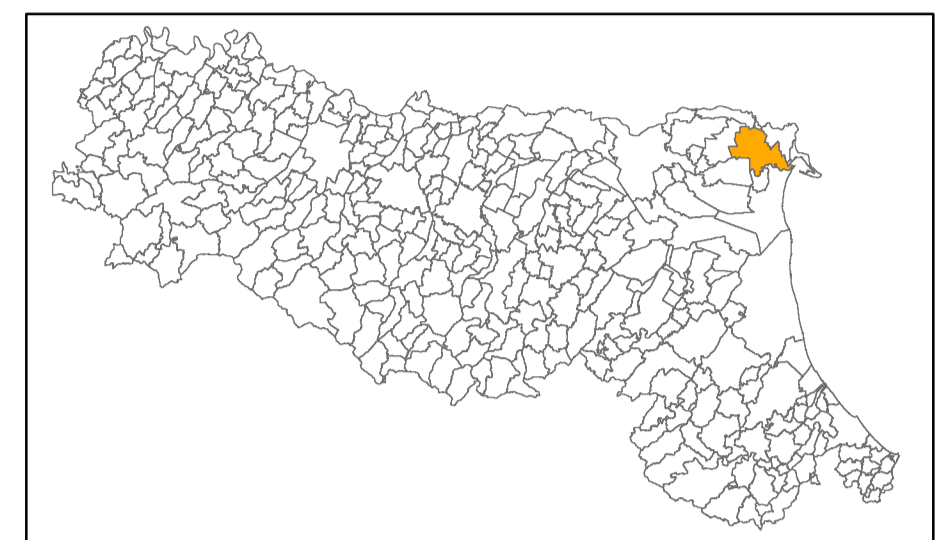
Tavola F2 - PGA

Regione Emilia-Romagna Comune di Codigoro