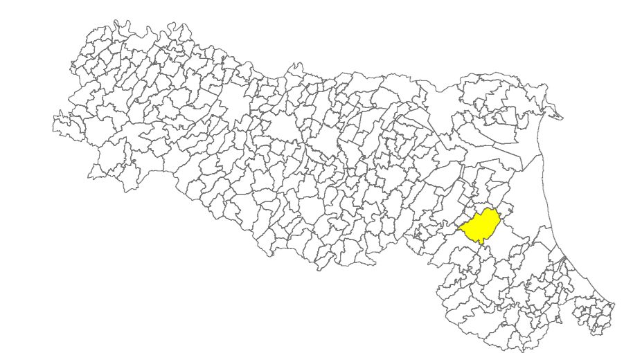
Tavola 1 d4